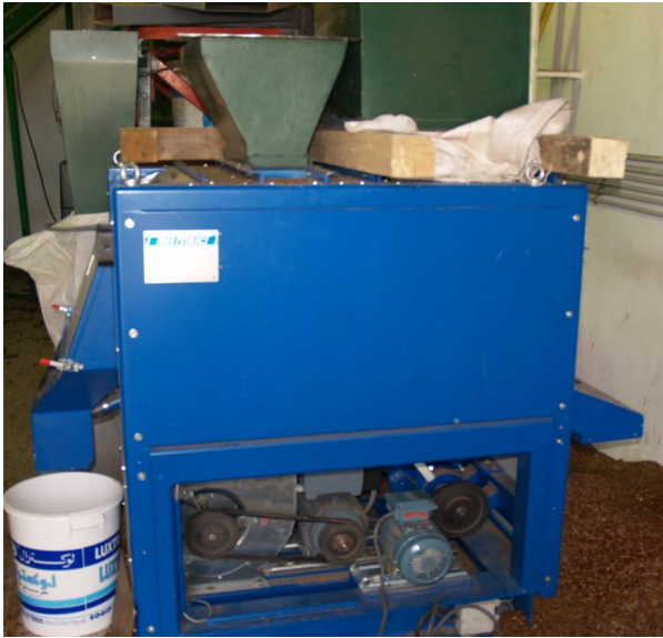
TABLE DE SEPARATION DENSIMETRIQUE POUR LES INDUSTRIES ALIMENTAIRE /MINERALE ET RECYCLAGE